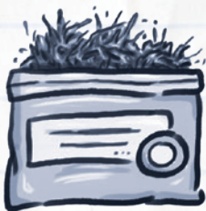
TABACO DE MASCAR