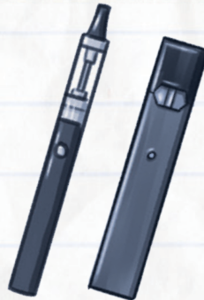
DISPOSITIVOS DE VAPEO